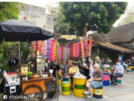
กาดนัดจีนยูนาน

เปิดมิชลิน ไกด์ ไทยแลนด์ ซึ่งขยายพื้นที่ความอร่อยจาก กรุงเทพฯ สู่จังหวัดเชียงใหม่