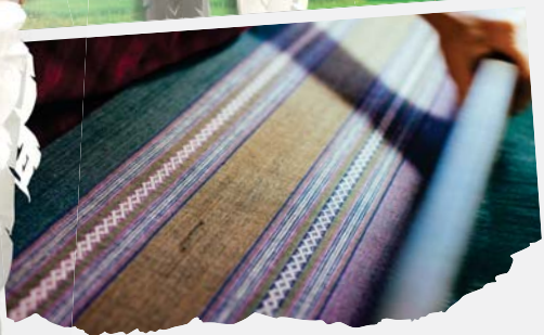
"กิจกรรมทอผ้า"