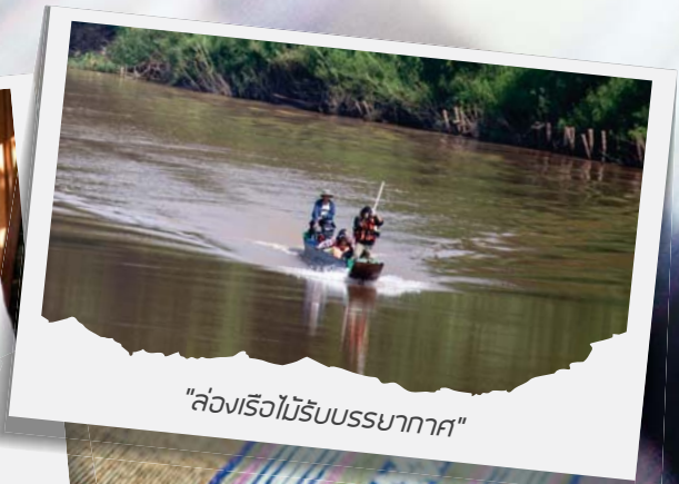
"ล่องเรือไม้รับบรรยากาศ"