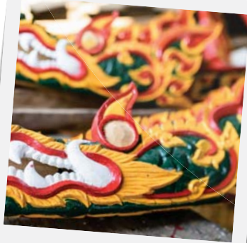
"หัวเรือแกะให้เป็นรูปพญานาค"

หัวเรื่อนั้นนิยมแกะให้เป็นรูปพญานาคเช่นเดียวกับหางเรือที่เรียกกันว่าหางวรรณ ช่างทุกคนต่างบอกเป็นเสียงเดียวกันว่าการแกะสลักนั้นต้องใช้สมาธิบวกกับอารมณ์ที่ดีไม่หงุดหงิด ซึ่งก็คงจริงเพราะเห็นทุกคนดูยิ้มแย้มแจ่มใส พูดคุยกันเฮฮา เมื่อแม่น้ำจางมายังคนต่างถิ่นอย่างเราอีกต่างหาก ทั้งสังเกตการณ์และทดลองด้วยตัวเองและยังเดินชมที่บริเวณไปมาซึกจะรู้สึกหัว ฟูๆ คลายคนแบบนำไปหาอะไรกินที่ร้านบ้านก๋วยเตี๋ยว ที่เราเองพอชิมแล้วก็ติดใจจนต้องมาบอกต่อ พออึ้งคาวแล้วรู้สึกอยากหาอะไรหวานๆ และเครื่องดื่มเย็นๆ มาล้างปากกันต่อ โปรแกรมนี้ขอเลยว่าต้องเป็นที่จำนนคอฟฟี่ แอนด์ แกลลอรี่ เพราะไม่ได้มีดีแค่รสชาติอาหาร หรือกาแฟ แต่การตกแต่งร้านยังดึงดูดใจด้วยการนำรถเมล์เก่ามาแปลงร่างให้ได้เข้าไปนั่งจิบกาแฟกันชิลล์ๆ เพราะที่ตั้งเคยเป็นอู่รถเมล์เก่ามาก่อน จากนั้นก็ไปเดินชมแกลลอรี่กันต่อแล้วค่อยปิดท้ายด้วยการแวะซื้อของฝาก ของที่ระลึกกัน