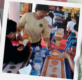
"ทำตุ๊กคำคิง"