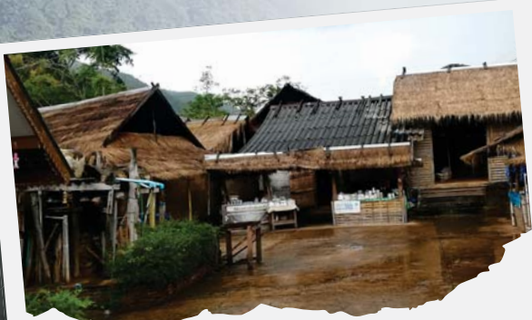
"หมู่บ้านชาวบ่อเกลือ"

วันรุ่งขึ้นจัดการกับข้าวเข้าก้นแล้วก็มุ่งตรงสู่บ่อเกลือกินแต่ข้าว เพราะระหว่างทางเราอยากแวะชมทะเลหมอกที่จุดชมวิว 1715 วันก่อน ไม่อยากไปสายเที่ยวไม่ได้ภาพหมอกขาวฟูๆ ซึ่งก็ฟูสมใจสวยเหมือนถึงเมฆบนฟ้าลงมาปรายวิเวือนือฟูเบา เก็บวิวกันจนอ้อมก็ไปต่อขึ้นบ่อเกลือกินเลย บ่อเกลือที่นี่แปลกกว่าที่อื่นตรงที่เกลือไม่ได้มาจากน้ำทะเลแต่มาจากบ่อบนภูเขาสูง มาดูชาวบ้านเขาต้มเกลือโดยตักน้ำจากบ่อส่งมาตามท่อในรางไม้ไฟให้ไหลมาสู่บ่อพัก การทำเกลือก็คือตักน้ำจากบ่อมาต้มในกระทะใหญ่ใช้เวลานาน 4-5 ชั่วโมง รอกเกลือระเหยแล้วก็ใช้ไม้พายมาตักขึ้นไปตากไว้ในตระกร้าซึ่งแขวนไว้เหนือกระทะอีกที ปล่อยให้น้ำไหลลงมาสู่กระทะแล้วก็ตักขึ้นไปใหม่ วนกันไปพอน้ำในกระทะแห้งก็ตักจากบ่อมาเติมใหม่ บนนี่คือถ้ำรูปปั้นชะมด ทั้งภาพอาร์ทๆ ที่ชาวบ้านกำลังตักน้ำทำเกลือ และภาพสวยๆ ของวิวที่นี่ที่สวยงามขนาดแบบเอาแค่ขึ้นมาชมวิวอย่างเดียวก็คุ้มแล้ว ก่อนกลับมาเสพวิวริมน้ำใส แกล้มไก่ทอดมะเขว่น ยำผักกูด และชาสมุนไพรบ่อกินหน่อย ที่บ่อเกลือวิว ร้านน่ารัก วิวดี อาหารอร่อย ผักสดก็ปลูกกันอยู่ที่แปลงผักส่วนตัวนี่เอง ชิลขนาดนี้ไม่อยากกลับแล้วนะเนี่ย ขอยุ่ที่นี่อีกสักปีเลยได้ไหม