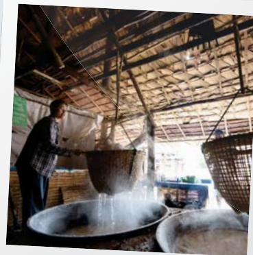
"การทำเกลือ"