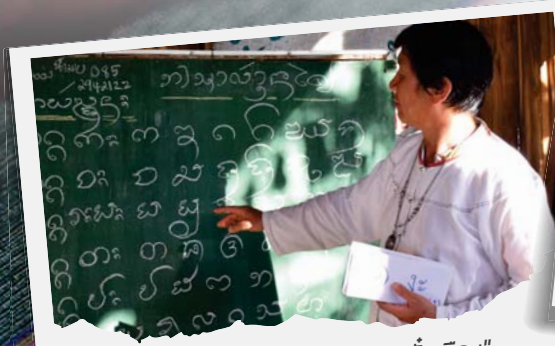
"อาจารย์ระดม สอนเขียนตัวเมือง"