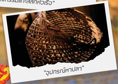
"อุปกรณ์หาปลา"

เห็นหัวเรือหรือหัวโองามๆ ที่จัดแสดงอยู่แล้ว ก็รู้สึกอยากรู้ขึ้นมาเลยเรียกว่าช่างเขาแกะสลักหัวเรือเหล่านี้ขึ้นมาได้อย่างไรกันนะ และความสงสัยก็ได้รับคำตอบที่วิเศษหอม เราได้ชมทั้งช่าง และลูกมือซึ่งก็คือน้องเด็กๆ ในวัดนั่นเอง ช่วยกันทั้งแกะสลัก ตกแต่ง ซ่อมแซมหัวเรือต่างๆ อยู่เพื่อใช้ในงานประเพณีแข่งเรือที่จะมีขึ้นในช่วงหน้าหนาวนี้ โดยมีท่านเจ้าอาวาสเป็นหัวเรือใหญ่ และรับให้ความรู้แก่ผู้ที่สนใจอยากเรียนรู้ศิลปะชนิดนี้