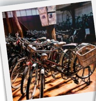
"เขื่อนรถถีบ"