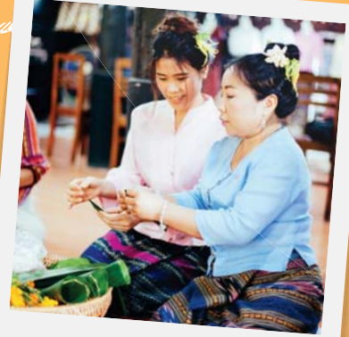
"ทำสรวยดอกไม้"

เช้าวันที่สองเราขอเช่าสู่วิวเมืองกันบ้าง เริ่มที่การทำตุ๊กคำคึงกันที่วัดพระเกิด ตุ๊กก็คือธง คำคือความสูง และคึงก็คือตัวเรา รวมกันแล้วจึงหมายถึงว่าวันนี้เราจะ มาทำธงแขวนแบบล้านนาที่มีขนาดความสูงเท่ากับตัวเรากัน แม่อุ๊ยบอกว่าตุ๊กคำคึง นี้ชาวล้านนาเขาเชื่อว่าจะช่วยสืบชะตาหรือสะเดาะเคราะห์ได้ แล้วแม่ก็ยื่นตุ๊กที่ทำจาก กระดาษสายาวเท่าตัวเรามาให้เราตกแต่งเครื่องหน้าเอาเอง ส่วนลวดลายอื่นๆ บนตุ๊ก อย่างบทสวดอิติปิโสหรือลายสะบัดด้านล่างที่ถือเป็นการสะบัดทุกข์โรครกภัยให้มลาย ไปนั้นเขากำมาให้แล้วไม่ต้องกลัว ถวายตุ๊กแล้วก่อนจะไปต่อขอเติมพลังที่ร้านก๋วยเตี๋ยวเนื้อ จานเด็ดจากสุราษฎร์ฯ ที่มาสร้างชื่อกันที่น่านก็เลยได้ซื้อร้านก๋วยเตี๋ยวสุราษฎร์ธานี ไปแต่โดยดี อิ่มอร่อยแล้วมาฝึกจรวดแบบสาวล้านนาที่ห้องเจ้าฟองคำ ซึ่งเราจะมาทำ สรวยดอกไม้เอาไปถวายพระกัน ก่อนอื่นก็เดินชมหรือคุ้มนี่ที่ตกทอดกันมา สู่ลูกหลานของเจ้าผู้ครองนครน่านในอดีตให้ทั่วๆ กันเสียก่อน เพื่อซึมซับความเป็น อยู่ตามแบบล้านนาโบราณที่แบ่งส่วนตัวบ้านเป็นส่วนบ้านที่อยู่อาศัย ครัว ยุงข้าว และบ่อน้ำ วนจนจบแล้วเราก็นั่งพับเพียบเรียบร้อยมันไวบตองให้เป็นกรวย จับจับให้เป็นยอดแหลม ซึ่งต้องใช้ความใจเย็นและมือเบาขั้นสุด เสียงเพลงล้านนาแผ่วๆ ทำให้ใจสงบและเริ่มมีสมาธิกับงานตรงหน้า และแล้วความพยายามก็นำมาซึ่งความสำเร็จ สรวยหรือกรวยไวบตองใส่ดอกไม้ฝีมือเราก็อามาโชว์ได้ในที่สุด และก็ไต่เวลาพักจิบกาแฟกันอีก แล้ววงนี้เลือกไปที่ร้าน Sweety 9 บ้านไม้หลังนี้เป็นแหล่งที่วัยรุ่นน่าน เขามานั่งชิลสิ้ๆ จิบเครื่องดื่มเย็นๆ กัน เราก็เลย เอาบ้าง ขอบอกว่า Green Refresh คือรีเฟรชดีสุดๆ อีกอย่างที่เขาว่าก็คืออาหารเช้าพื้นเมืองสโตน่าน ไว่คราวหลัง จะไม่พลาดมาแวะชิมแต่เข้า