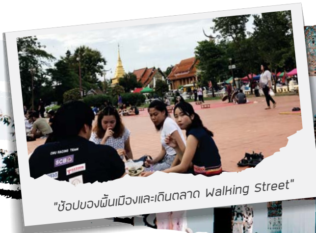
"ช้อปปิ้งของพื้นเมืองและเดินตลาด Walking Street"

เป็นเมืองที่ชอมมาก สมายมาก เจริญอาหาร สุดๆ อิ่มแล้วถึงออกเดินทางไปปัตกันต่อ เพราะคืนนี้เราจะไปนอนพักโรงแรมดีไซม์เก้ ที่สุดในเมืองปัตที่ Cocoa Valley Resort บอกกันไว้เลยว่าช็อกโกแลตลาวา และโกโก้เย็นที่นี้เด็ดมาก ไม่ควรพลาด