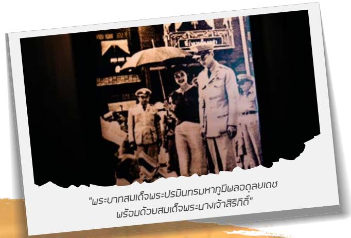
"พระบาทสมเด็จพระปรมินทรมหาภูมิพลอดุลยเดช พร้อมด้วยสมเด็จพระนางเจ้าสิริกิติ์"

ช่วงเวลาแห่งความสุขมักจะผ่านไปเร็วเสมือนนั้นอาจจะไม่จริงเสมอไป เพราะการเดินทางเนิบช้า เก็บเกี่ยวความประทับใจตามรายทางไปเรื่อยๆ ใช้เวลาตีบท่ำกับแต่ละสถานที่อย่างไม่เร่งไม่ร้อน สำหรับบางคนแล้วคือการเสพความสุขแบบง่าย ๆ แต่ทำให้ได้พลังชีวิตคืนมาแบบลีนปรี๊ แต่มาด้วยการสัมผัสเสน่ห์ของเมืองแบบลึกซึ้งอย่างที่การท่องเที่ยวแบบผ่านๆ ไม่อาจให้ได้