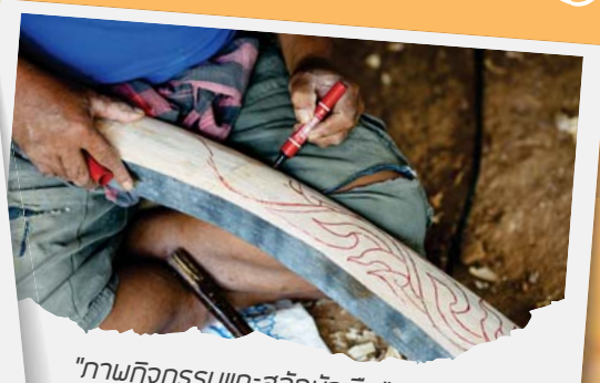
"ภาพกิจกรรมแกะสลักหัวเรือ"