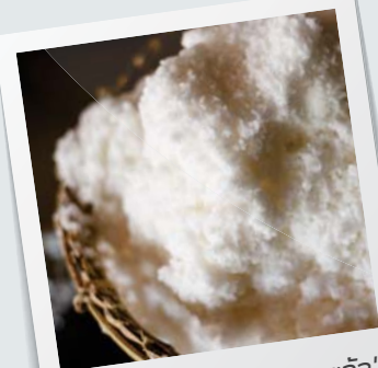
"เกลือที่ผ่านกระบวนการแล้ว"