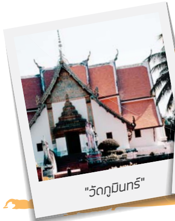
"วัดภูมินทร์"

วิถีคนชิลล์อย่างเราตกบ่ายก็ต้องออกปั่นสัคะ บันเรื่อย ๆ เนิบ ๆ ชมวิวทั่วทั้งหลายที่อยู่ไม่ไกลกันนัก ก่อนอื่นไปแวะกันที่ ศูนย์บริการนักท่องเที่ยวเทศบาลเมืองน่านที่อยู่กลางเมืองตรงข้ามวัดภูมินทร์กันก่อน แวะชมภาพพระซันรักบันลือโลก แล้วไปต่อที่วัดพระธาตุช้างค้ำที่อยู่ไม่ไกลเช่นกัน เข้าไปชมเจดีย์ช้างค้ำศิลปะสุโขทัย แล้วข้ามมาที่พิพิธภัณฑ์สถานแห่งชาติน่าน ที่มีจุดไฮไลท์สำหรับนักท่องเที่ยวคืออุโมงค์ต้นไม้ชุ่มสีลาวดีด้านหน้าที่เอื้อต่อการถ่ายภาพสวยๆ มาก และถือย่าส้มไป แวะวัดที่เล็กที่สุดในประเทศกันหน่อย ก็คือวัดน้อย จากนั้นไปเดินเล่นยามเย็นแวะช้อปปิ้งของพื้นเมืองและเดินตลาดหาข้าวซอย น้ำพริกหนุ่ม ใส่อ้วนมันงึนกลมชมวิววัดกันที่ช่วงเมืองน่าน