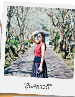
"ชุ่มสีลาวดี"

เป็นเมืองที่ชอมมาก สมายมาก เจริญอาหาร สุดๆ อิ่มแล้วถึงออกเดินทางไปปัตกันต่อ เพราะคืนนี้เราจะไปนอนพักโรงแรมดีไซม์เก้ ที่สุดในเมืองปัตที่ Cocoa Valley Resort บอกกันไว้เลยว่าช็อกโกแลตลาวา และโกโก้เย็นที่นี้เด็ดมาก ไม่ควรพลาด