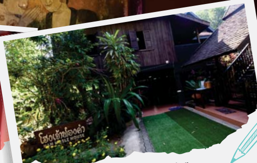
"ห้องเจ้าฟองคำ"