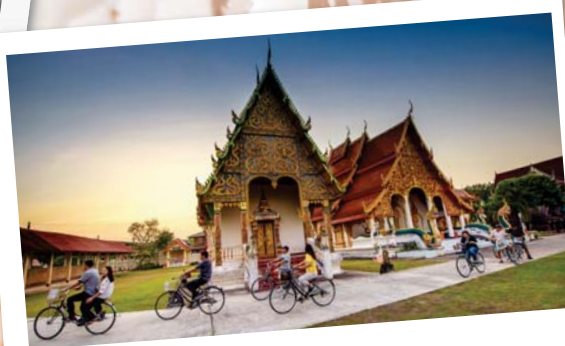
"ปั่นจักรยานชมเมือง"