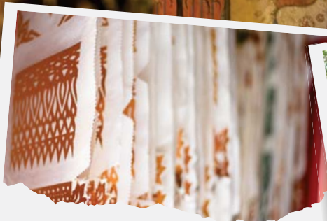
"ทำตุ๊กคำคึงกันที่วัดพระเกิด"