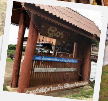
"บ้านกะหลีกโฮมสเตย์"

อาจารย์บอกว่าถ้าจะล่องเรือต้องรอช่วงแดดร่มพระอาทิตย์ใกล้ตก ถึงจะได้โอไรท์ภาพสวยประทับใจ เราเลยขอถือโอกาสดูอาจารย์เคาะกะหลีกให้อาหารปลากันก่อน โดยอาจารย์เริ่มจากตักลงปูจาให้ฟัง แล้วเคาะกะหลีกซึ่งในสมัยก่อนใช้เป็นสัญญาณบอกเหตุหรือเรียกประชุม แล้วชักบอกให้ตระกร้าที่แขวนไว้เลื่อนไปจนถึงปลายทางในแม่น้ำ เสียงรอกดังเอี้ยดฮาดอาจารย์คงเห็นเรากำลังงงงงวย เลยรีบอธิบายว่าอาจารย์ไม่ใช่ไม่น้ำมันรอกเพราะอยากให้มันผิดพลาดถึงจะได้มีเสียงดังพวกปลาจะคุ้นชินกับเสียงนี้ด้วยเหมือนกันจะได้รู้ตัว ไม่ใช่เพราะความเท่าหรืออาจารย์ขี้เกียจรอกนะ ฮ่าๆ