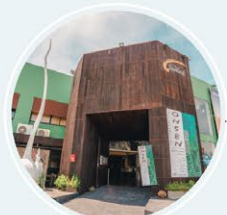
ชีวศิลปะ