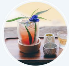
ร้านอาหาร มาลองเตอะ