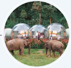
อนันตรา สามเหลี่ยมทองคำ แคมป์ช้าง แอนด์ รีสอร์ท