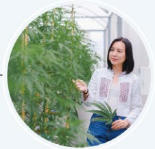
จิตรรักษาฟาร์ม