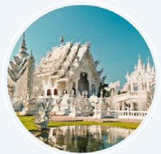
วัดร่องขุน