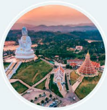
วัดห้วยปลากั้ง