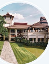
เลอ เมอร์เดียน เชียงใหม่ รีสอร์ท